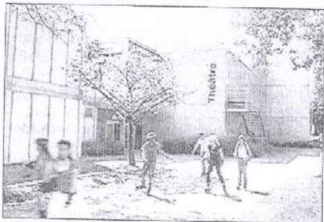
Le Théâtre Vidy-Lausanne est une importante structure culturelle, posée au bord du lac Léman.